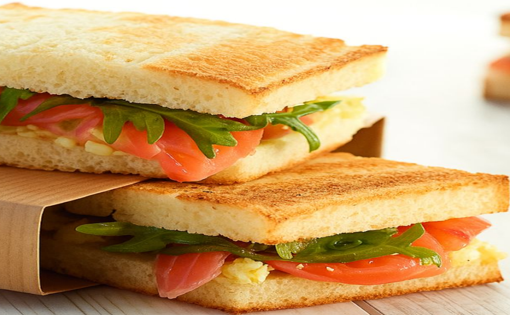
CROQUE SAUMON ROQUETTE