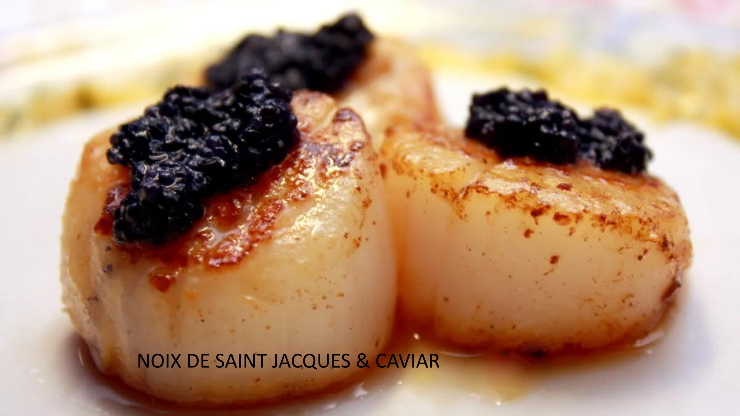
NOIX DE SAINT JACQUES & CAVIAR